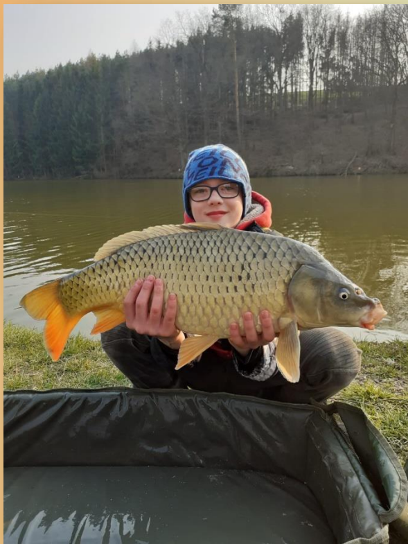
↑ Absolvent rybářského kroužku.