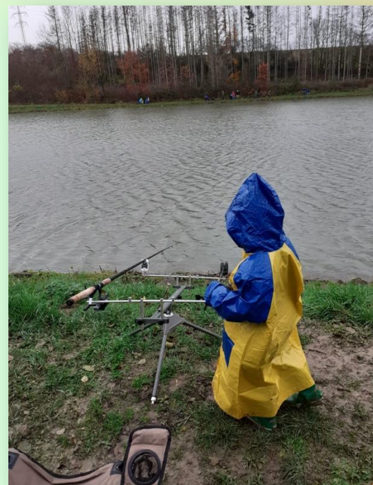
↑ Výjezd rybářských kroužků r. 2019

Ilustrační video z dílny MRK sledujte pod odkazem a nezapomeňte, že video je ukázkové. Časem si každý rybář techniku lovu upravuje podle svých zkušeností.